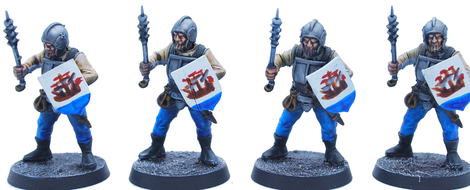
Groupe de Gardes lacustres équipées d'un Morgenstern et d'un Bouclier