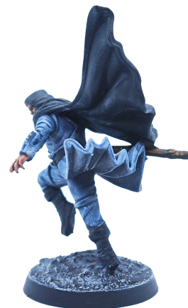
Assassin de la Confrérie

L'Assassin, même sans s'en prendre à sa cible, reste correct en mêlée, surtout si on lui donne une autre arme que sa Dague dès la deuxième partie (par exemple si l'on peut lui trouver un Morgens-tern, comme nous le ferons dans la bande qui suit, en le transférant du Commandant de la Garde lors de la première séquence d'après-bataille). Alors évidemment, n'allez pas le lancer sur le chef de bande adverse, mais si un ou deux miliciens se baladent dans leur coin sans renfort, pourquoi ne pas leur tomber dessus par surprise ? Ou encore, ce Kobold parti tout seul fouiller un bosquet excentré pourrait faire une très mauvaise rencontre dans les bois.