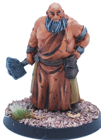
Un Forgeron très attaché à son tablier!

Par exemple : les règles du Forgeron indiquent que celui-ci est équipé d'un Marteau et d'un Tablier de cuir. Il doit donc être recruté tel quel.