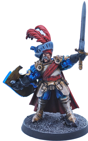
Commandant de la garde

– le Morgenstern – et leur donner un peu de résistance – le Bouclier – ainsi que trois Pêcheurs servant de chair à canon complètent la bande pour lui donner du corps et une solidité relative, avec un seuil de déroute à 3 figurines.